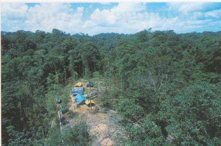
Campement clandestin situé à plus de 100 km à l'intérieur de la forêt (Dorlin).

Ces actions des forces de gendarmerie, souvent soutenues par des personnels de l'ONF* et/ou de l'ONCFS**, et destinées à faire respecter le droit et les lois de la République en Guyane, doivent être soulignées ici. Et il convient de féliciter ces services d'intervention qui ont eu le courage d'assumer leur responsabilité et leur devoir. Mais ces actions ne répondent pas